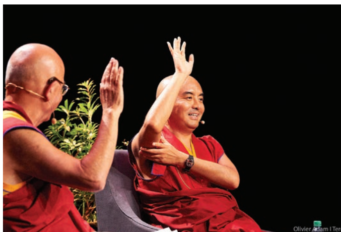
Mingyur Rinpoche conduz Matthieu Ricard e o público presente ao lançamento do livro em Paris em um exercício de conscientização da sensação corporal, setembro de 2019.

“O conteúdo dos vídeos mais curtos foi ótimo - e eu gostei da boa mistura de experiências de aprendizado com interação. O ritmo e a variedade foram realmente bem pensados.”