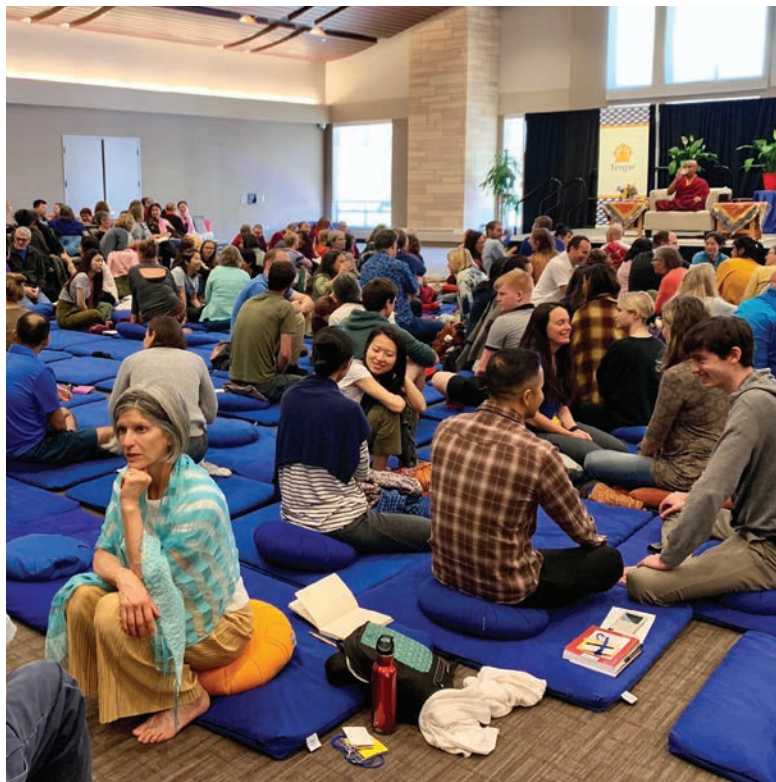
Mingyur Rinpoche tem acrescentado mais elementos experienciais a seus próprios ensinamentos, como esse pequeno grupo de discussão durante o retiro Alegria de Viver de 2019 em Saint Paul, Minnesota.