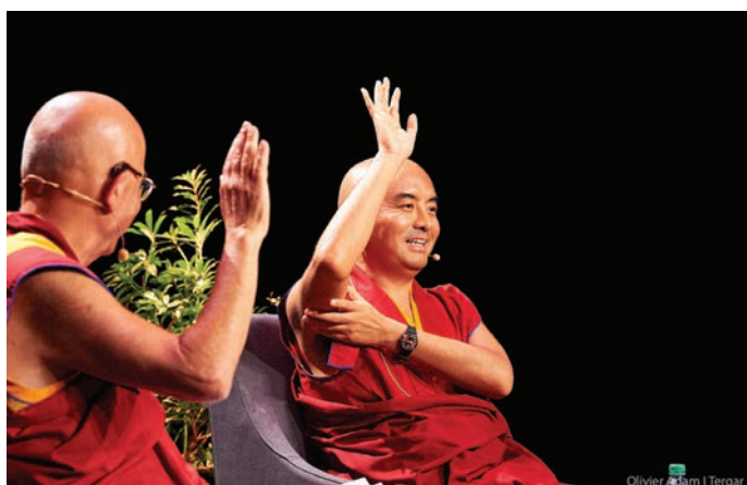
Mingyur Rinpoché guide Matthieu Ricard et le public dans un exercice de prise de conscience des sensations corporelles, lors de la soirée autour du nouveau livre de Rinpoché en septembre 2019 à Paris.

“Le contenu vidéo plus court était excellent - et j’ai apprécié le bon mélange d’expériences d’apprentissage et d’interaction. Le rythme et la variété étaient vraiment bien pensés.”