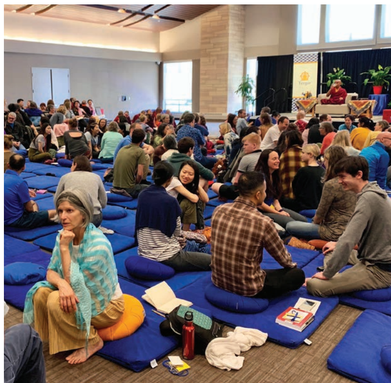
明就仁波切在他自己的教学中，增加了更多的个人体验部分，正如在2019年明尼苏达州圣保罗的“开心禅”闭关中，这个小组在分享他们的经历。

我们要对永给·明就仁波切，支持德噶（Tergar）活动的慷慨捐助者，德噶（Tergar）的学生和志愿者，以及参加“开心禅”工作坊和在线课程的世界各地的所有人士，表示极大的感谢，他们的参与丰富了这一新的培训，也要感谢德噶（Tergar）员工，五位讲师和三十六名辅导员，各种beta测试人员，以及所有以各种不同方式提供了帮助的人士，是他们使得这些变革性的教程得以与如此之多的人分享。