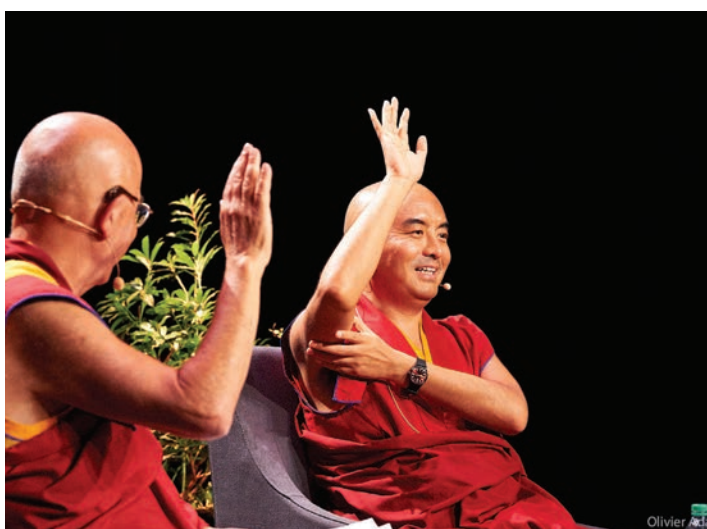
明就仁波切领导Matthieu Ricard和一个巴黎读书会在做对身体感受的觉知的练习，2019年9月。