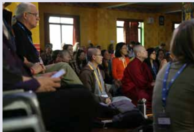
Собрание сообщества Тергар стало уникальной возможностью для лидеров Тергар Азия и Тергар Интернешнл вместе встретиться с Мингьюром Ринпоче. Более 200 лидеров сообщества Тергар — ведущих практики и координаторов, администраторов, фасилитаторов, инструкторов и сотрудников — приняли участие со всего мира.