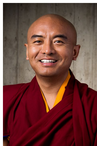
Мингьюр Риинпоче, Главный Учитель

занятий в группах, она будет осуществлять онлайн курсы на английском, датском и испанском языках. Кроме того, количество инструкторов Тергар, ведущих семинары по «Радости жизни» было увеличено вдвое (с 8 до 16). Они работают по всему миру и на многих языках.